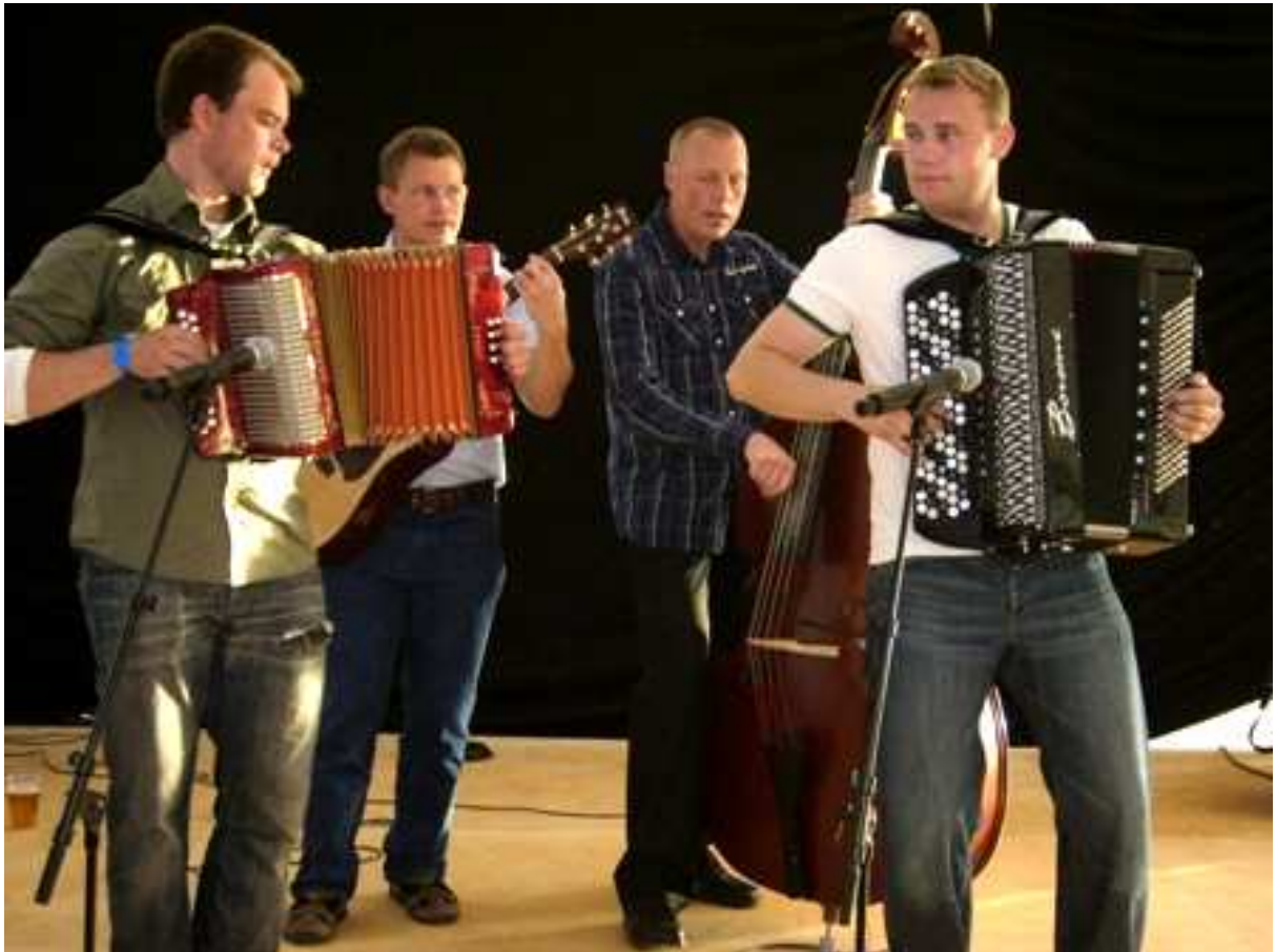
Karane spela og på Landsfestivalen i Vågå i 2007