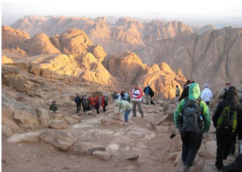
Sinaifjellet er ein del av eit stort granittmassiv

Det blei sein middag den kvelden. Geitekjøtet var seigt, men det glei ned. Romma på gjestehuset var spartanske, men det var ikkje mange timane vi skulle sove. Eg hadde så vidt blunda, då det banka på døra, klokka var 01.45. På tide å hoppe i anorakken og overtrekksbuksa og få lykta på hovudet. Ullkleda hadde vore på heile natta, det var kaldt i rommet. Ute i mørkret gjorde glovarm te godt i ein kald og søvning skrott. Å sjå soloppgangen frå toppen av Sinaifjellet, var målet vårt.