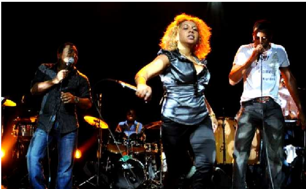
"Pupy y Los Que Son, Son" i aksjon